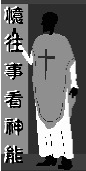
憶往事看神能