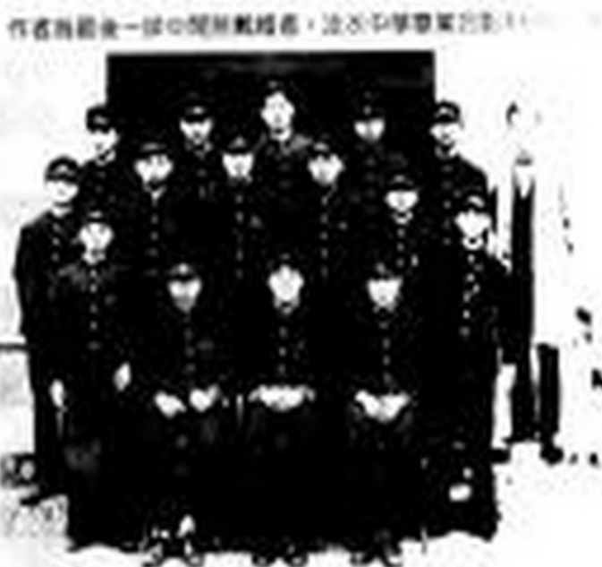
Khia tī 最後一排 中間無戴帽è 是作者

2001年 為著小學ê 鄉土母語教育 教育部委託地方政府，舉辦 外聘ê 母語師資鑑定考試