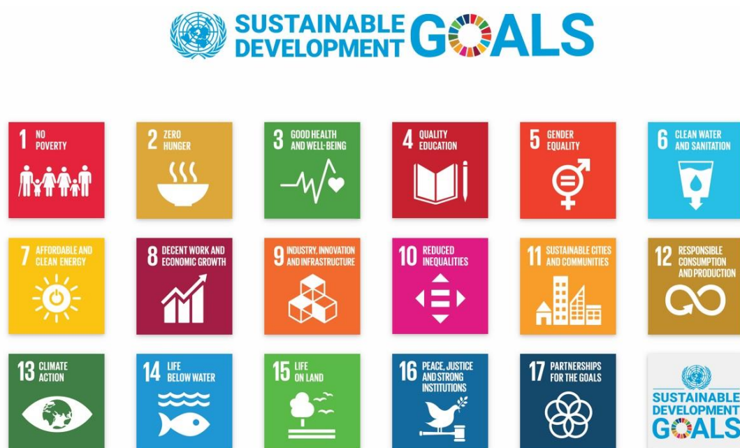
圖 2. 聯合國 SDGs 圖示（來源：UNDP 2015）

Tiàm 聯合國 ê 網站 ē-tàng 看 tiòh SDGs 詳細 ê 紹介 chham kàu taⁿ 全世界執行 ê 狀況。17 項 SDGs 有 khah 濟字 ê 版本（UN 2015a；吳宜瑾 2018:57），為 tiòh 方便用圖示來展現，iā 有 khah 少字 ê 簡單版，tī chia 咱 thèh 簡單版來紹介：