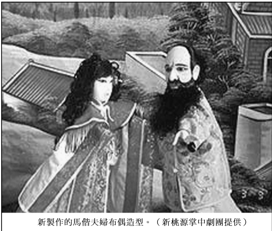
新製作的馬偕夫婦布偶造型。

清國官: (大驚一 tiò) 啥物英國領事到, 開中門迎接! (領事入....) 清國官: 有何貴事? 英領事: 貴事是不敢當, 自古無事不登三寶