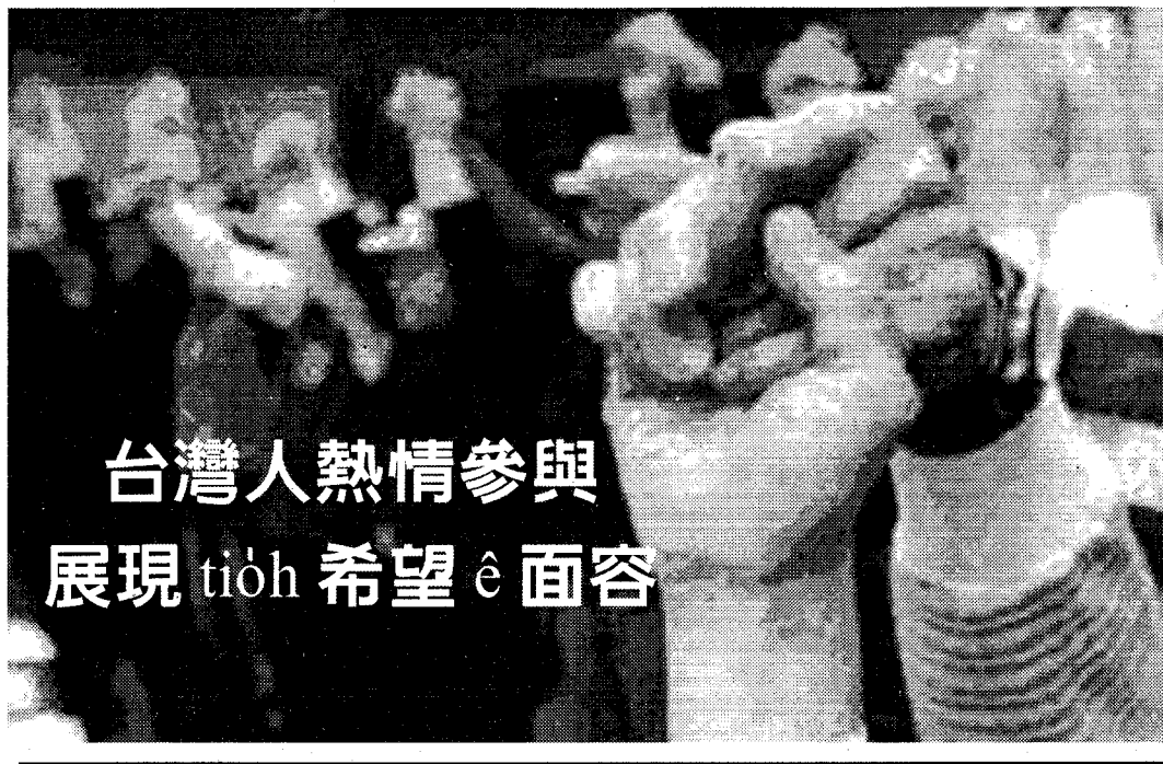
台灣人熱情參與 展現 tiòh 希望 è 面容

為 tiòh è-tàng 用最快速度 è 上傳,掠準總部有直接 è 專線,就帶手提電腦 koh tng 來「歐洲櫻花村」, Chit