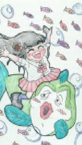
插圖: Sherry Thompson

一向穿簡單 é 我，卻對 hiah-é 穿樸素 é 人，ju 來 tī 討厭；頂禮拜三，陰天 é 早起，因爲鋒